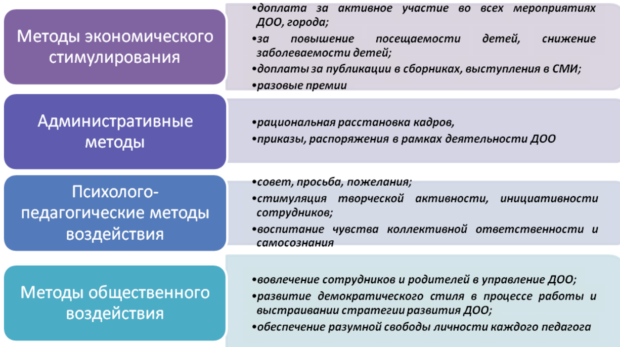
Рис 2. Методы управления в МБДОУ

Заведующий успешно осуществляет руководство. Управленческая компетентность и менеджерская ориентация позволяют руководителю успешно осуществлять образовательную и инновационную деятельность дошкольной образовательной организации.